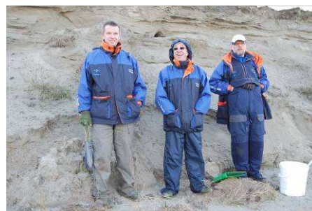
De wedstrijdleiding houdt alles in de gaten